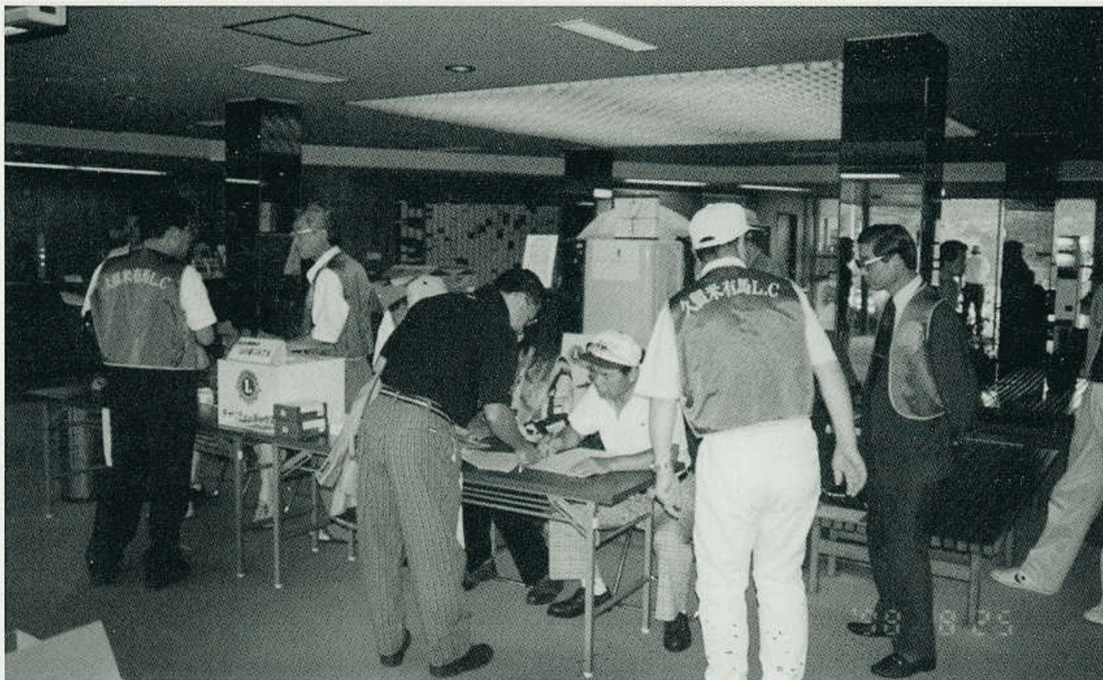
98年度青少年育成チャリティゴルフ大会 受付